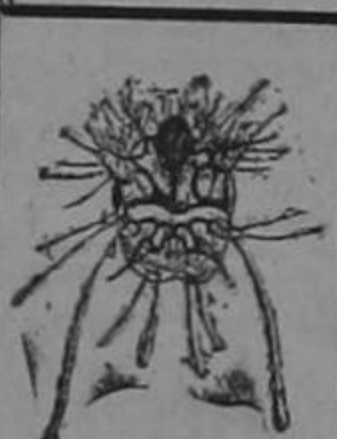
MACHO AUMENTO: 500 VECES

COMBATA ESA PICAZÓN O RASQUÍÑA CON EL FAMOSO ACEITE VERDE